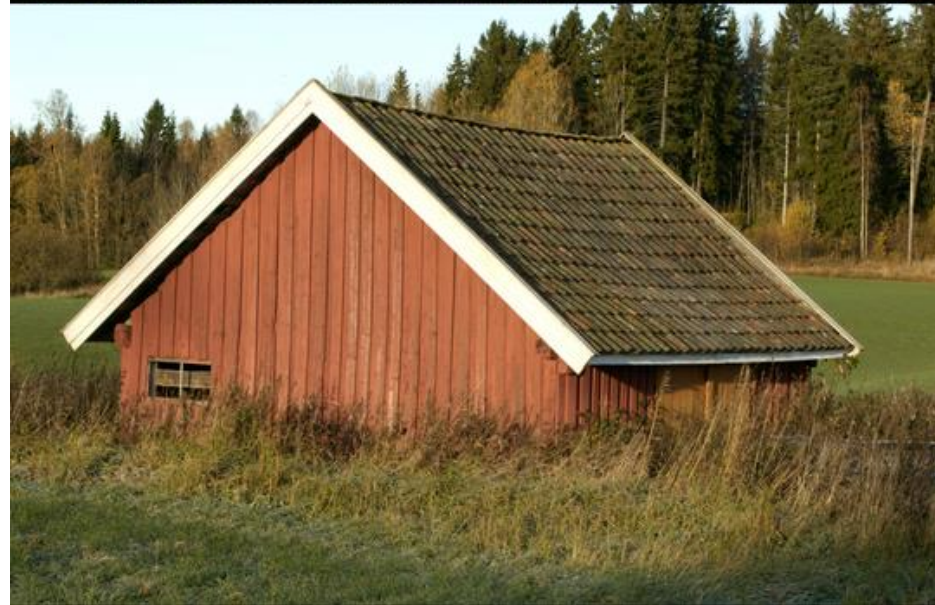
Sommerfjøs, Hylli i Spydeberg